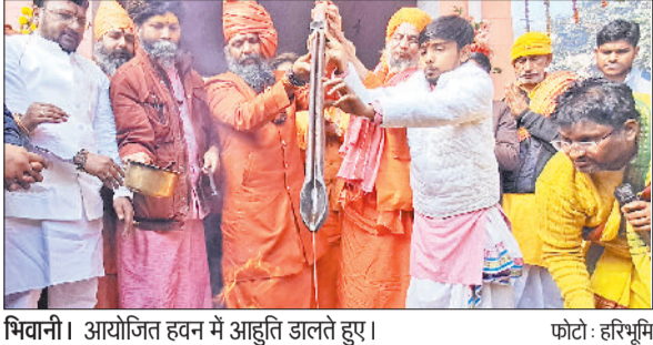
भिवानी। आयोजित हवन में आहुति डालते हुए।