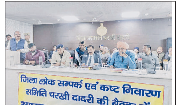
चरखी दादरी। जिला लोकसंपर्क एवं परिवेदना समिति की बैठक में जनशिकायतें सुनते कृषिमंत्री श्याम सिंह राणा।

बैठक में लंबित शिकायतों में आदेश के अनुसार कार्यवाही हो जाती है तो उन्हें भी निवारण की श्रेणी में शामिल कर लिया जाएगा। बैठक के बाद कृषि एवं किसान कल्याण मंत्री श्यामसिंह राणा ने कहा कि अधिकारियों को स्पष्ट निर्देश दिए कि शिकायतों की जांच में पारदर्शिता बनाए रखें व शिकायतकर्ता को हर चरण में शामिल किया जाए ताकि समाधान प्रभावी और संतोषजनक हो। कृषिमंत्री राणा ने कहा कि वर्तमान सरकार जनता की समस्याओं को गंभीरता से सुनने और समाधान करने को लेकर प्रतिबद्ध है। प्रत्येक माह ग्रीवेंस कमेटी की बैठक