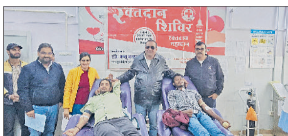
भिवानी। रक्तदाताओं को बेज लगाकर सम्मानित करते हुए।

प्रशासन के पास 104, मई में 91, जून में 102, जुलाई में 159, अगस्त में 139, सितंबर में 208 और नवंबर में 120 समस्याएं पहुंची। दिसंबर महीने की बात करें तो जिला प्रशासन के पास 136 समस्याएं पहुंची। ऐसे में जिला प्रशासन के पास पूरा सालभर में समाधान शिविरों में करीब 3761 समस्याएं पहुंची, जिसमें करीब 2735 का समाधान किया जा चुका है।