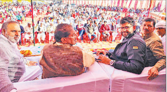
नारनौल। सम्मेलन में मौजूद जजपा नेता व कार्यकर्ता।

जननायक जनता पार्टी की ओर से दौंगड़ा अहीर चौक पर जिला युवा योद्धा सम्मेलन महायुवा योद्धा सम्मेलन बन गया। इसमें आए पार्टी के राष्ट्रीय अध्यक्ष डॉ. अजय सिंह चौटाला ने कहा कि आप लोगों के मेहनत की वजह से पार्टी के स्थापना दिवस पर आयोजित जौद जिले के जुलाना में आयोजित रैली की सफल हुई। चौटाला ने भारतीय