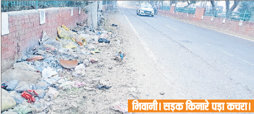
भिवानी। सड़क किनारे पड़ा कचरा।

कई बार नप के अधिकारियों द्वारा शहर की सफाई का ठेका देने की योजना का खाका तैयार करके भेजा, लेकिन भेजे गए मसौदे पर कई बार आपत्ति लगाकर शहरी निकास विभाग ने वापसी लौटा दिया। यह सिलसिला पिछले ढाई साल से चल रहा है। नगरपरिषद के अधिकारी नई हद्दियतों के हिसाब से तैयार करते हैं, लेकिन जब फाइल उपर भेजी जाती है तो कुछ न कुछ हद्दियतों को लागू करने में कोई न कोई कमी रह जाती है। जिस वजह से ढाई साल से शहर की सफाई (झाड़ू लगाने) का ठेका नहीं हो पाया है। अंदरूनी शहर की बजाए रिंग रोड के साथ लगती बाहरी कॉलोनियों में सफाई नहीं हो पा रही है। जिसके चलते बाहरी इलाकों में सड़क व गलियों में अनेक जगहों पर रेत व कचरे के ढेर पड़े हैं। जो कि स्वच्छता को प्रहण लगा रहे हैं।