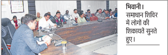
भिवानी। समाधान शिविर में लोगों की शिकायतें सुनते हुए।