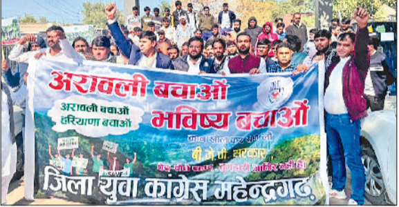
नारनौल। प्रदर्शन करते कांग्रेस कार्यकर्ता।