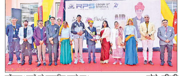
महेंद्रगढ़। बच्चों को सम्मानित करते हुए।