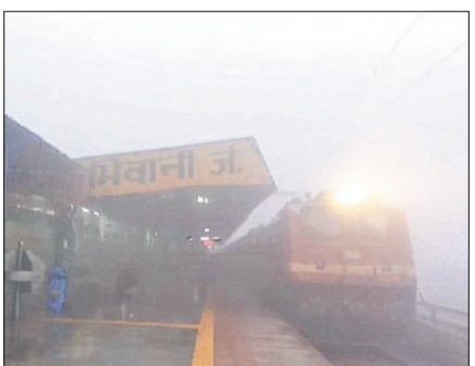
भिवानी। धुंध चिरकर गंतव्य की ओर जाती रेलगाड़ी व धुंध की गहनता के बीच गुजरता एक वाहन।

सोमवार को भी सर्दी ने अपने तेवर दिखाए। अल सुबह से ही धुंध की चादर तनी रही। दोपहर तक धुंध की गहनता की वजह से वाहन चालक लाइट जलाकर एक दूसरे वाहन के पीछे चलते नजर आए। दोपहर बाद धीमी गति से हवा चली तो धुंध की